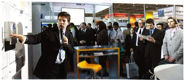
E-Energy zum Anfassen: Die Hannover Messe bietet Gelegenheit für Information und Austausch zum Thema „Smart Grids“.

Stroms setzt man auf den „Innovativen Regionalen Erneuerbaren Tarif“ als Anreiz für die örtlichen Bewohner. Netzseitig entwickelt die Modellregion Harz ein Messsystem für die Netzzustandsüberwachung, mit dem der Netzbetrieb trotz der Integration erneuerbarer Energien effizienter und wirtschaftlicher gestaltet werden kann. Ganz neu startet im Harz das E-Mobility-Projekt Lemon, das 100 Elektrofahrzeuge und 150 Ladestationen in das virtuelle Kraftwerk einbezieht.