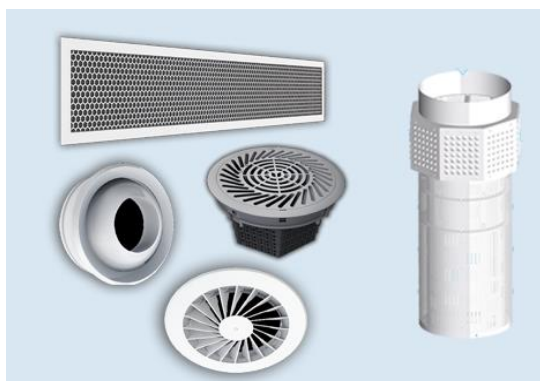
Unter dem Namen IntelligentIndustry präsentiert LTG den Industrieauslass ILQsf (rechts) und weitere Auslässe für die Belüftung von großen Hallen und Sälen.