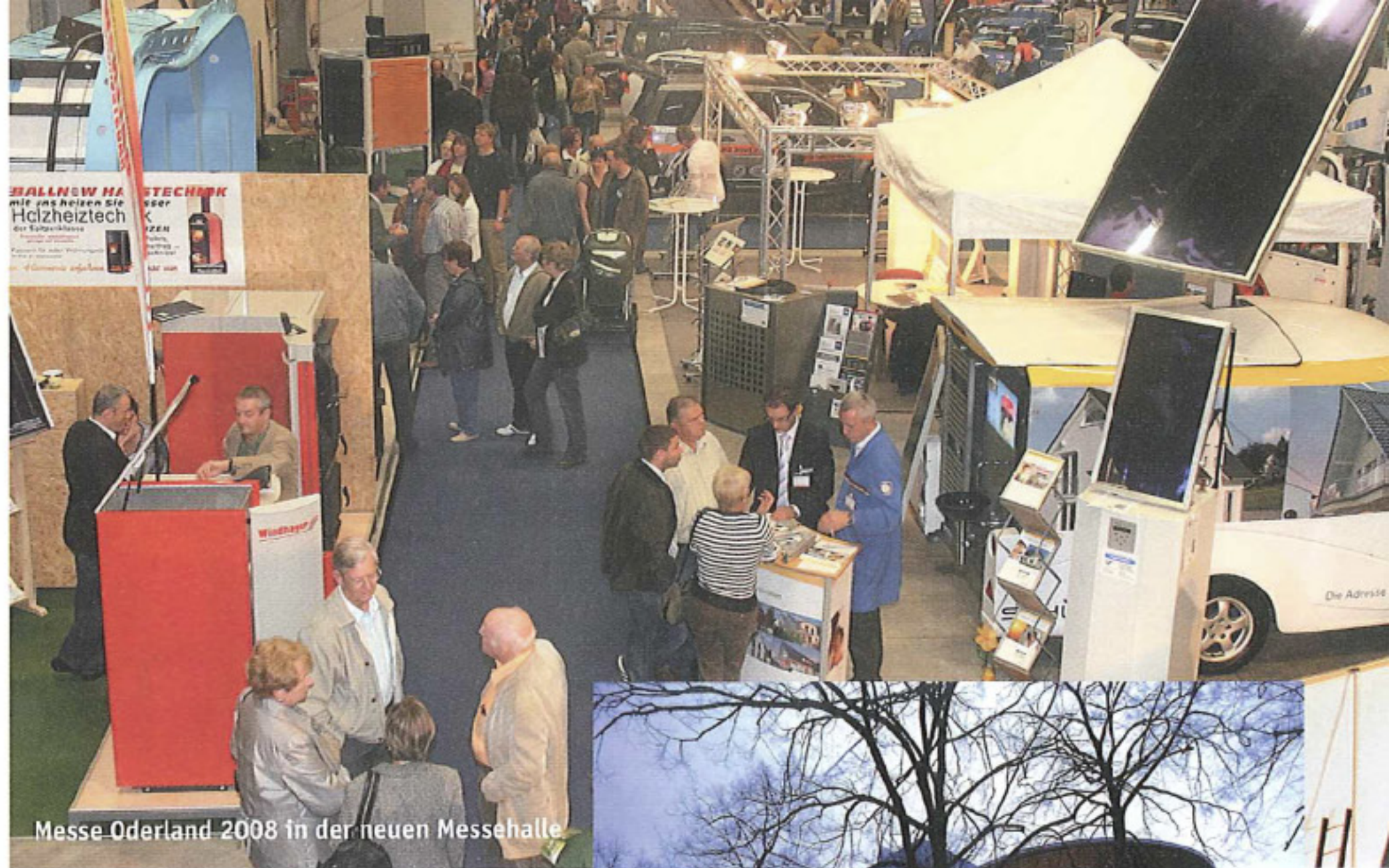
Messe Oderland 2008 in der neuen Messehalle