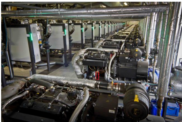
Kaskadenkonfiguration der Spanner Holz-Kraft-Anlage