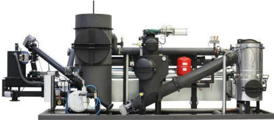
Die Spanner Holzvergaser

Neues integriertes Anlagenkonzept wird erstmals auf der Hannover Messe vorgestellt.