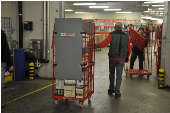
Die umweltfreundliche Transportsicherung Roll-Safe kommt bei der Spar AG zum Einsatz.