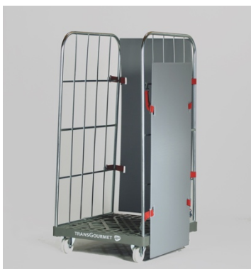
Die Variante „Roll-Safe flexible“ lässt sich problemlos abnehmen.