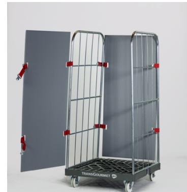
Bei der Variante „Roll-Safe fixed“ wird das Scharnierband fest am Container befestigt.